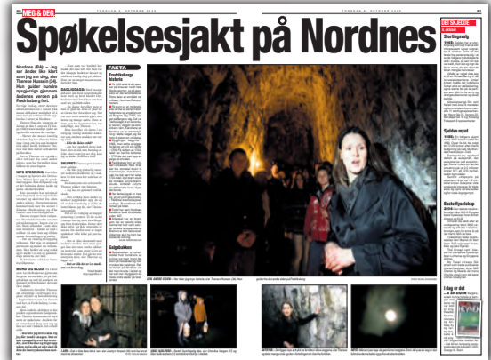
BA torsdag 8. oktober.